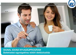
SIGNAL IDUNA NYUGDÍJPROGRAM Befektetési egységekhez kötött életbiztosítás