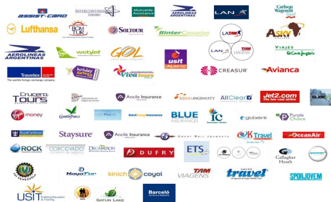
Utazási irodák, légitársaságok