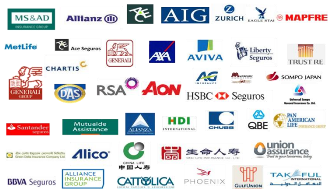
Biztosító társaságok, alkuszkok