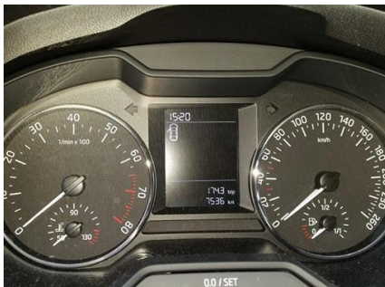
5. KÉP: KILOMÉTERÓRA