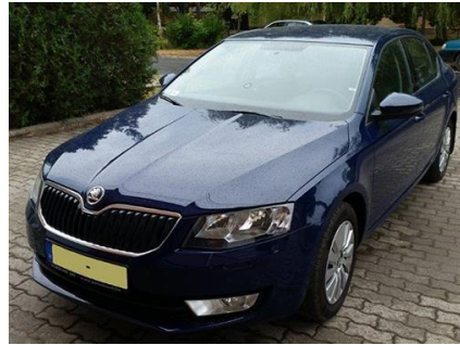
2. KÉP: AZ AUTÓ BAL ELSŐ NÉZETE