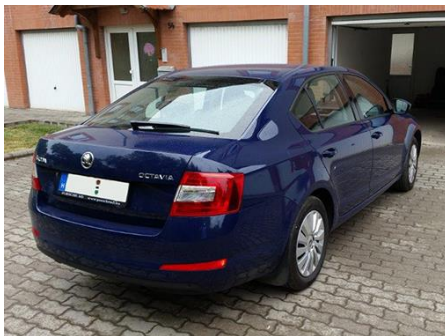
3. KÉP: AZ AUTÓ JOBB HÁTSÓ NÉZETE