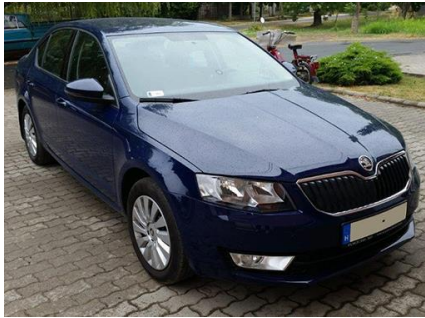
1. KÉP: AZ AUTÓ JOBB ELSŐ NÉZETE