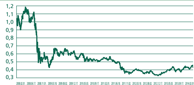
Klímváltozás és Megújuló Energia Euró Eszközalap