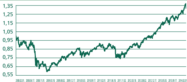
Idősödő Társadalom Részvény Euró Eszközalap