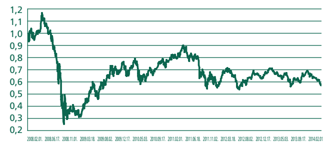
Felzárkózó Európai Részvény Euró Eszközalap