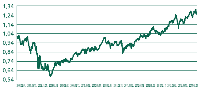
Víz és Környezetvédelem Euró Eszközalap