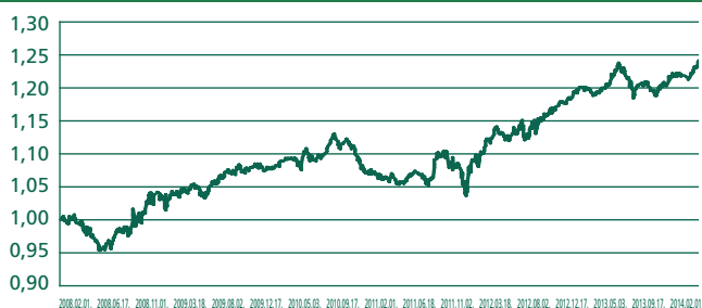
Európai Fejlett Piaci Állampapír Euró Eszközalap