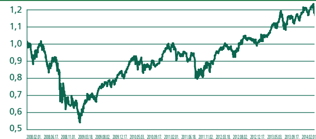
Globális Fejlett Piaci Részvény Euró Eszközalap