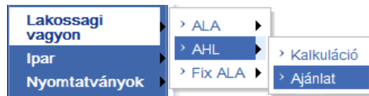
12. ábra Lakóközösség / Ajánlat menüpont

A Lakás / AHL / Ajánlat menüpontból, ill. a díjkalkulációs folyamatból.